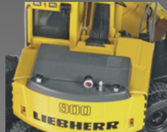
geänderte Motorabdeckung / changed engine hood

Maßstab / Scale : 1:50 Länge / Length : 175mm Art.-No. 803