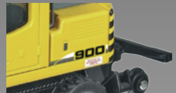
aktualisierte Beschriftung / updated design