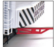
2 Zusatzgegengewichte / 2 additional counterweights