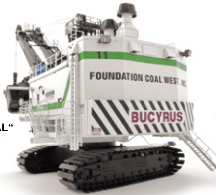
„FOUNDATION COAL“ Art.-No. 623/03