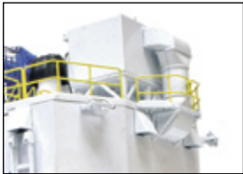
Ten Kay Luftfilter Anlage / Ten Kay air cleaner system