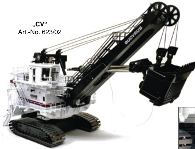
„CV“ Art.-No. 623/02

Maßstab / Scale : 1:50 Länge / Length : 630mm