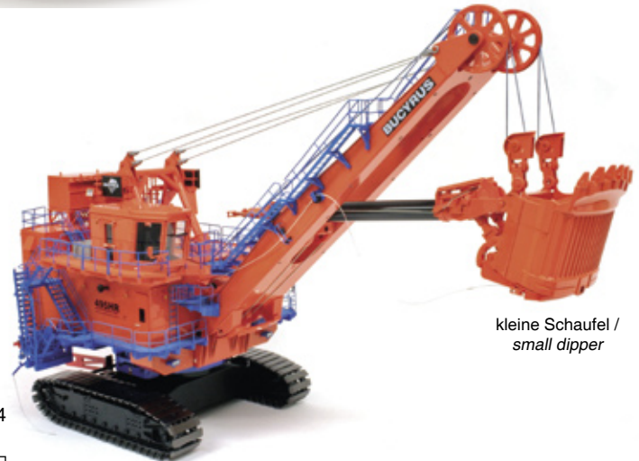
„LB“ Art.-No. 623/04