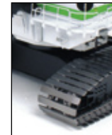
breite Ketten / width tracks