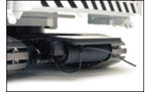
Kabelrolle für Elektrikanschluss / cable reel electrical connection